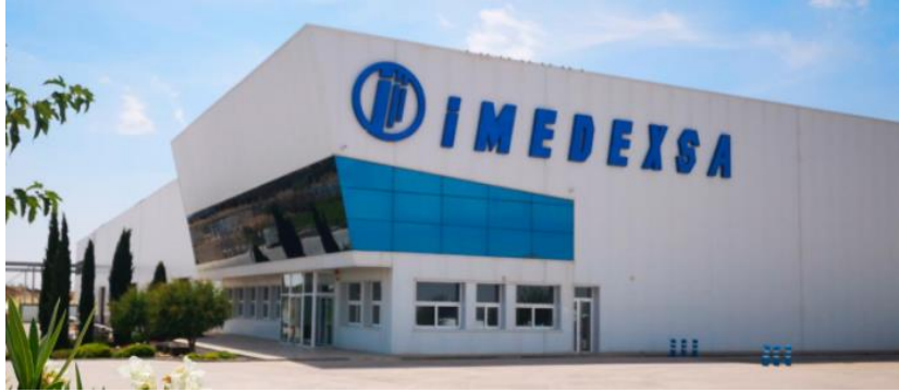
Figura: Fabrica Imedexsa localizada en Extremadura

Por otro lado, están las protecciones, que suelen ser de origen nacional, concretamente de la empresa Ingeteam (País Vasco) así como los transformadores de medida (tensión e intensidad) procedentes de la empresa Arteche (País Vasco).