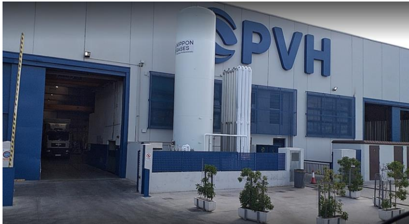
Figura: Fabrica PVHardware localizada en Valencia

Si hacemos referencia a las estructuras y a los seguidores, el grupo BRUC Energy suele apostar por proveedores regionales, entre los cuales se encuentran las siguientes empresas: Gonvarri (procedente de Bizkaia y Asturias), Renergy (Asturias), STI o Nclave (Navarra), o PV Hardware (Valencia), entre otras. En este caso, es muy probable que el suministro de estructuras metálicas sea suministrado por el fabricante PVHardware, cuya fabrica principal y oficinas centrales se localizan en la ciudad de Valencia. La mayor parte de los integrantes del equipo que compone la empresa PVHardware son de origen nacional.